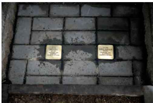
Stolpersteine věnované romským obětem holocaustu z brněnských Černoviček, 24. 9. 2017