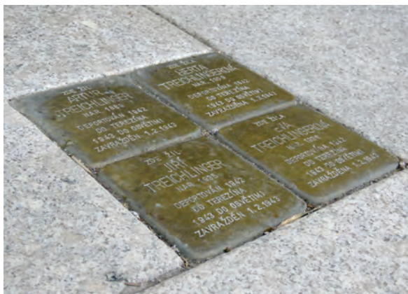
Stolpersteine položené v roce 2017.