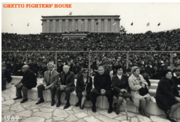
Oficiální ceremoniál Jom ha-šoa v roce 1969 v amfiteátru Muzea bojovníků ghetta - Lochamej ha-getaot, Izrael.

len proto, že se nachází mezi datem začátku povstání ve Varšavě (19. 4. 1943) a Dnem vzpomínky na izraelskou válku za nezávislost (začala 14. 5. 1948). Navíc spadá do období, kdy si Židé připomínají povstání Bar Kochby – hrdiny, který bojoval proti Římanům.