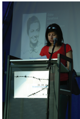
Jom ha-šoa, 25. dubna 2006, Praha

jedna z členek České unie židovské mládeže, která s nápadem na uspořádání Dne vzpomínání na oběti holocaustu ve veřejném prostoru přišla, a pořadatelek akce. „Já jsem měla silný zážitek z muzea ve Washingtonu, kde rozdávali návštěvníkům pasy jednotlivých lidí, kteří holocaust nepřežili. Rozhodli jsme se jít tedy touto cestou.“