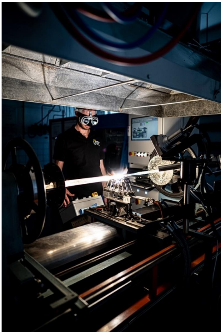
Sklářský soustruh pro přípravu preformy optického vlákna, tyčinky z křemenného skla o průměru cca 1 cm, ze které se pak vytáhne optické vlákno o průměru srovnatelném s lidským vlasem.