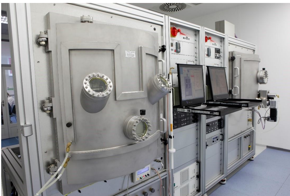
Ústav fyziky plazmatu AV ČR – TOPTEC / Komora pro depozici tenkých vrstev