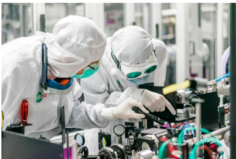
Fyzikální ústav AV ČR – Centrum HiLASE / Experimentální platforma pro vývoj tenkodiskových laserů